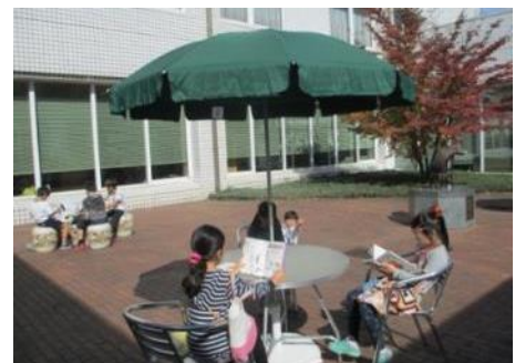
【夕方からはイルミネーション点灯中。中庭をのぞいてみてくださいね!】

新たにテーブルやパラソルを設置した中庭は、読書はもちろん飲食スペースや談笑の場としても利用できます。穏やかな日、気分転換に中庭で過ごしてみたいはいかがでしょうか。