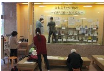
【ボランティアの方による資料展示設置の様子】

11月の月末館内整理日には、今年度から募集を開始した「資料展示ボランティア」の説明会を開催し、ボランティアの方と職員で『幕末志士の群像展 - 高杉晋作・坂本竜馬』をテーマにした資料を展示しました。中央図書館へご来館の際は、ぜひご覧になってみてください。